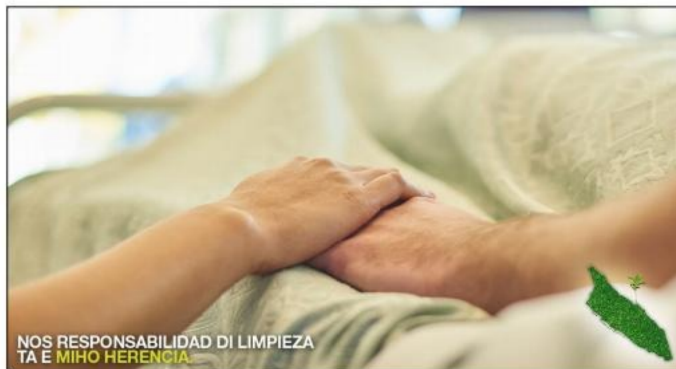
NOS RESPONSABILIDAD DI LIMPIEZA TA E MIHO HERENCIA

• E di cuater tarea cu lo wordo clarifica den e ley nobo ta, e tarea sumamente importante di Serlimar cu e tin pa percura pa nos espacio publiconan ta keda limpi y higienico pa sirbi interes nacional. E ley categoricamente ta indica cu no obstante e cuater tareanan cu a wordo clarifica y cu a duna informacion riba dje, na niun momento e intencion ta pa Serlimar bira un compania exclusivo pa locual ta e aspecto di desperdicio. E ley nobo, cu ta clarifica e ley di Serlimar tambe ta indica categoricamente cu companianan actual, operando den e sector aki por sigui opera conforme nan manera aworaki,